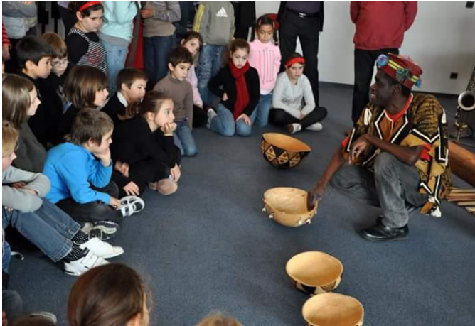
Rencontre au Centre socio-culturel d'Amabrès-et-Lagrave