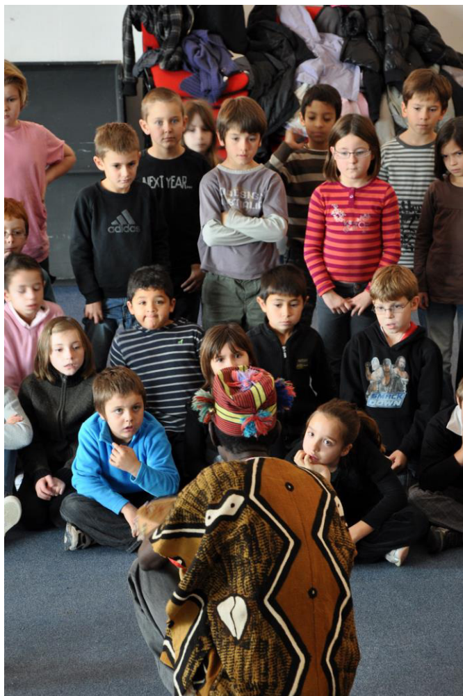
La magie de la rencontre opère ...