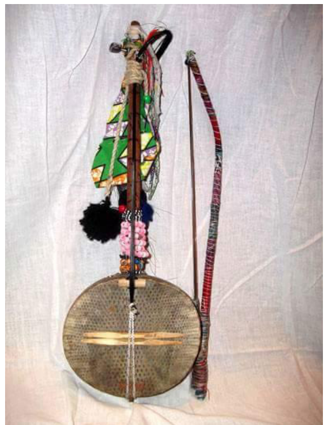
Le nianiérou (violon peulh), instrument de prédilection des griots

Le contenu et la durée sont adaptés en fonction du public et des demandes exprimées.